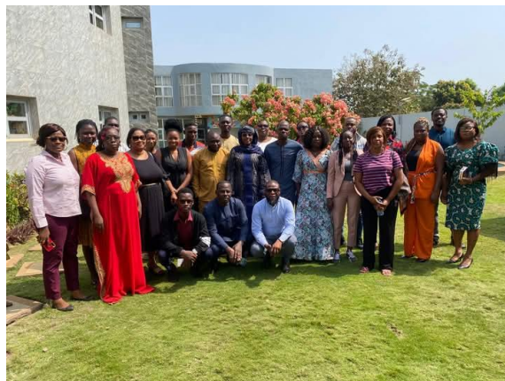
Photo de famille des participants à l'atelier