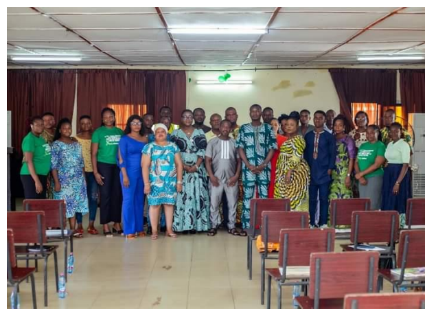
Photo de famille de l'atelier