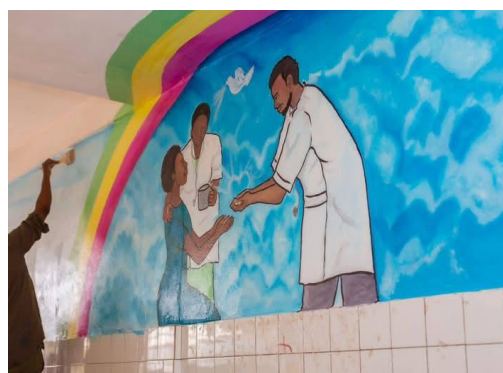
Les fresques murales effectuées par HFA sur les murs de l'hôpital psychiatrique de Zébé