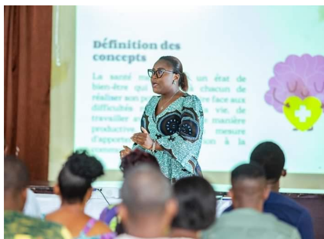
Présentation et plaidoyer autour du thème « Il est temps de donner la priorité à la santé mentale dans les entreprises »