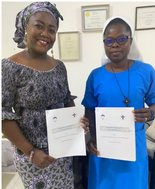
Notre partenariat avec le CSM Paul Louis René