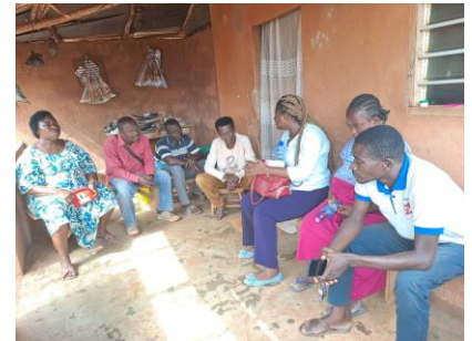
Sortie de Dame B2 pour sa réinsertion sociale