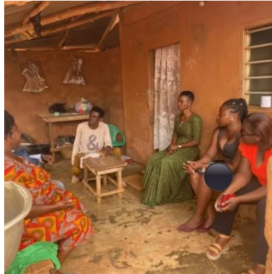
L'équipe HFA prépare les parents de Dame B2 à son retour