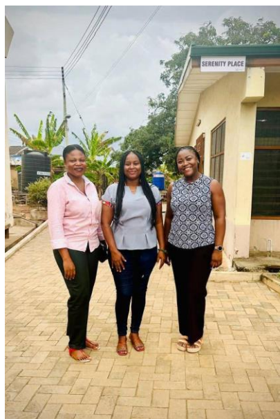
Rencontre avec la Program Manager de Serenity Place