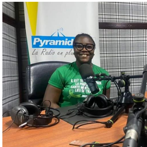
HFA à Radio pyramide FM