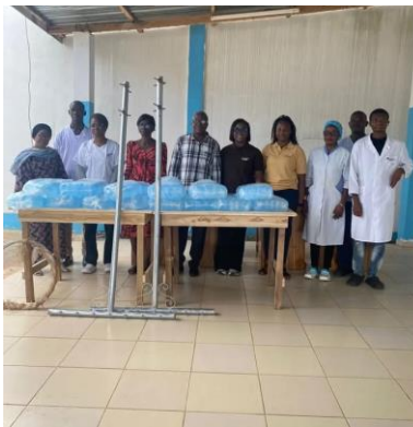
Photo de famille avec le personnel du service