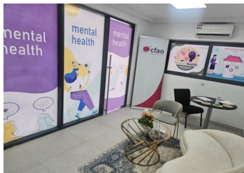
Mise à disposition des psychologues par HFA pour des consultations du personnel