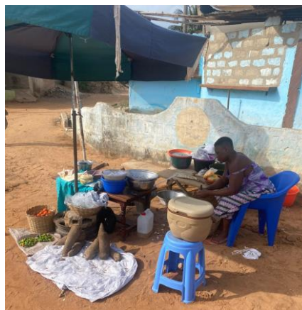
Commerce de Maman Sieur H1 financé par HFA