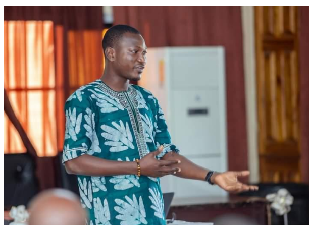
Les mots de bienvenue du représentant du DAGL