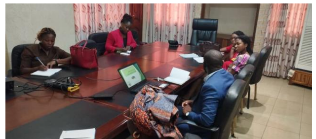
L'équipe HFA suivant la formation