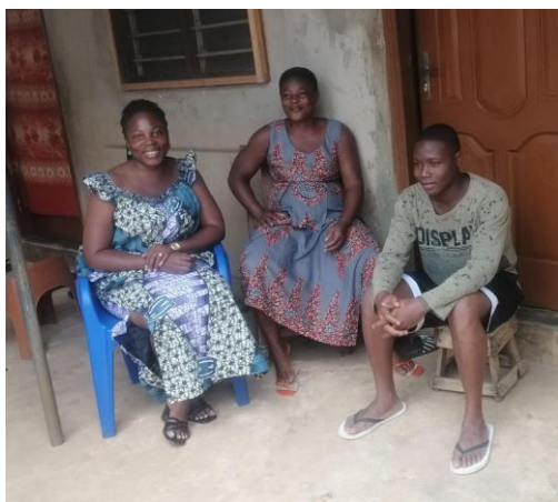
Visite à domicile du Sieur H1 après sa réinsertion sociale