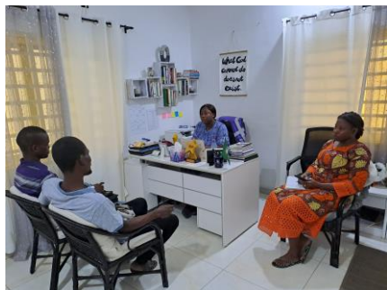
Ecoute pour demande d'assistance