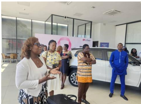
L'équipe HFA sensibilisant les employés de CFAO Mobility TOGO