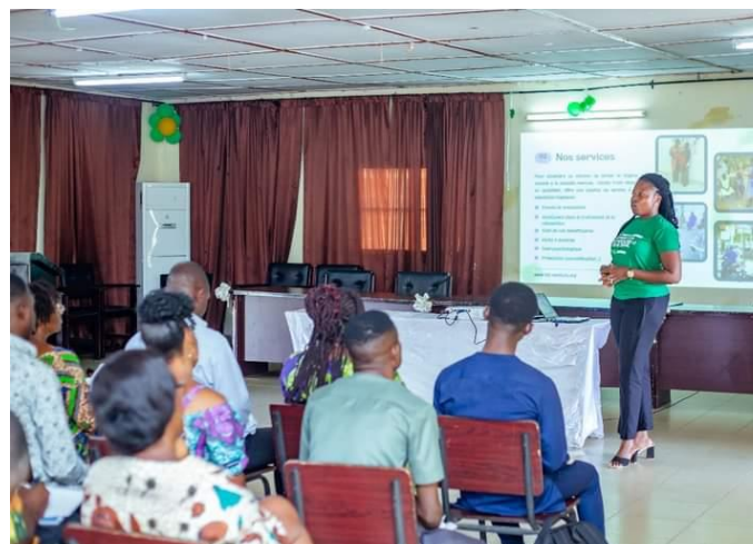
Présentation de HFA et ses actions