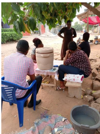
Visite à domicile chez Dame H1