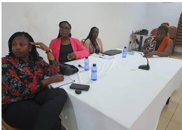
L'équipe HFA participant à l'atelier de formation sur le programme Strong Families à Kpalimé