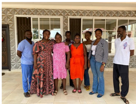
Photo de famille avec les responsables de Clubhouse et les résidents