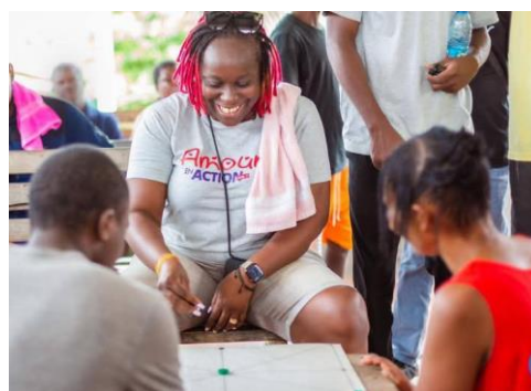
Activités de réjouissance avec les patients de Zébé