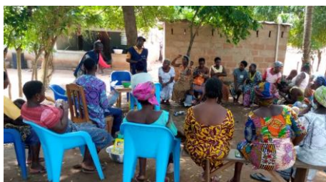
Sensibilisation à Sévagan sur les signes de la détresse