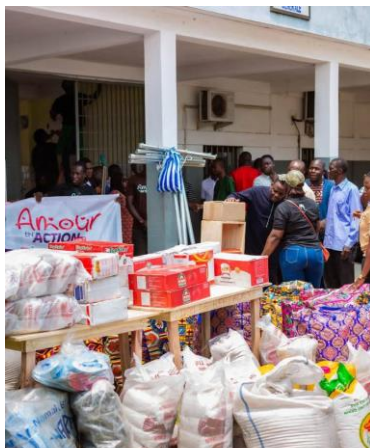
Dons de vivres et non vivres aux patients de l'hôpital psychiatrique de Zébé