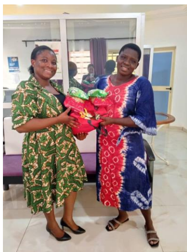
Don de vivres et non vivres à Dame H1