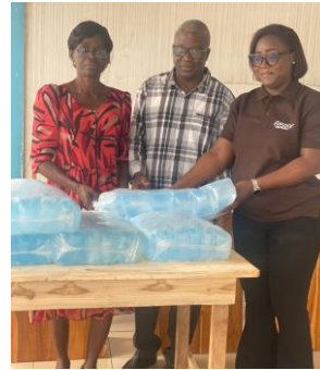
Remise solennelle des dons aux représentants du service