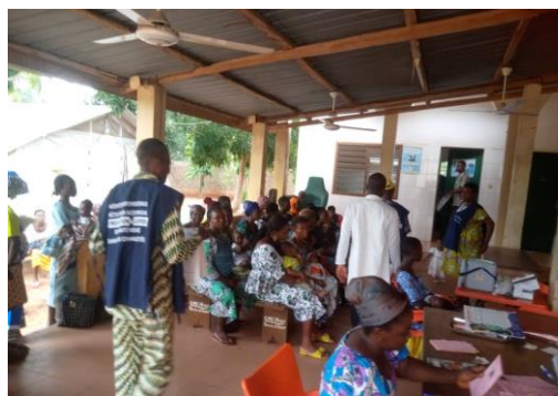
Sensibilisation à Kouvé sur la santé mentale positive et les signes de la détresse psychologique.