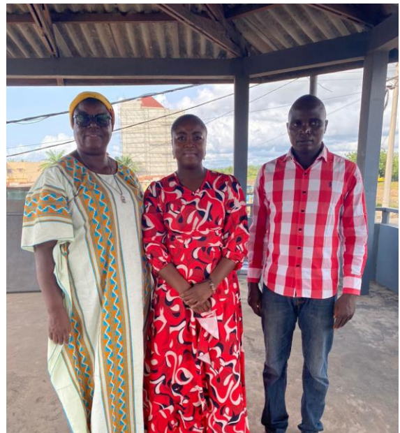
Notre partenariat avec le Centre Kekeli