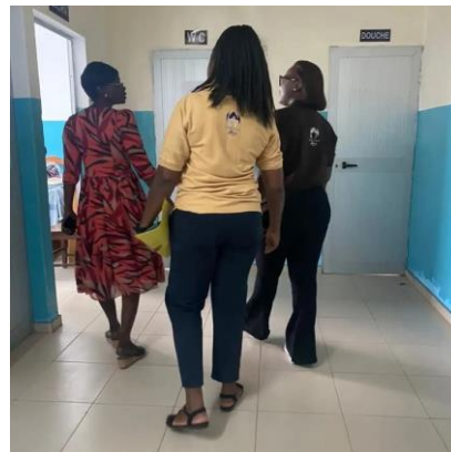
Visite guidée du service psychiatrique du CHU Campus Lomé