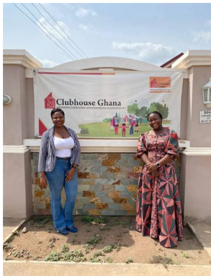
Les Responsables d'HFA à Clubhouse