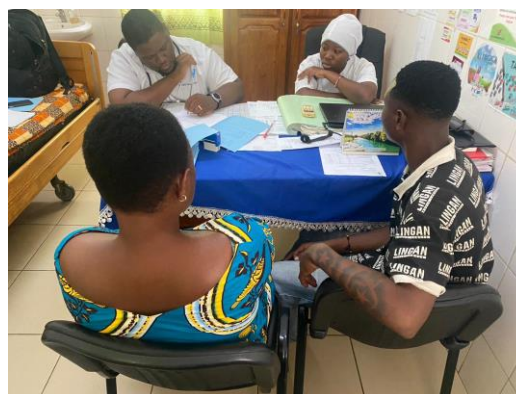
Hospitalisation du Sieur H1 au CSM Paul Louis René