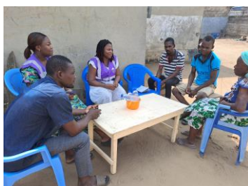
Des visites de prise de contact de nouveaux bénéficiaires