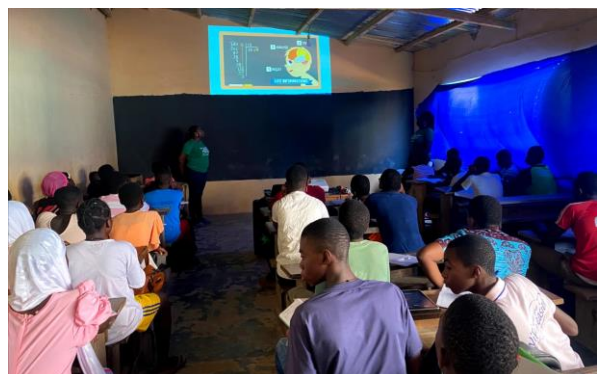
Equipe HFA sensibilisant les élèves du secondaire de l'école bonnes semences