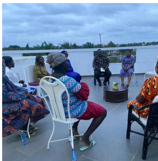
Groupe de soutien autour du thème « se reconstruire après un abus, stratégies pour la guérison et la résilience »