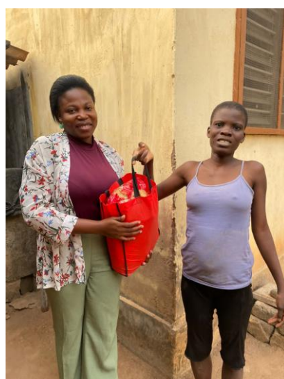
Des visites à domicile pour suivi de nos bénéficiaires