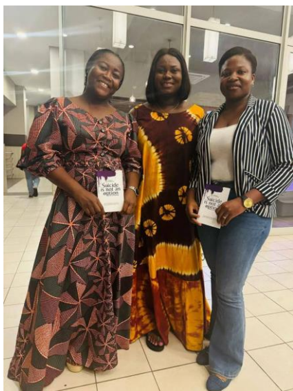
Rencontre avec la première activiste de la prévention du suicide