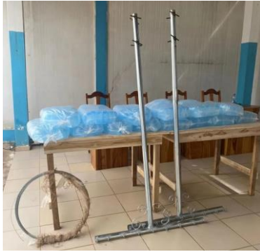
Dons à remettre au service de Psychiatrie du CHU Campus