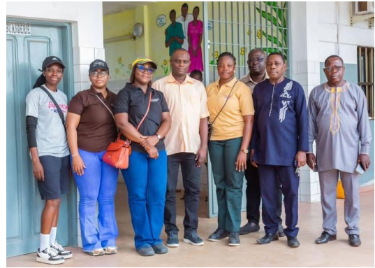
Photo de famille avec l'administration de l'hôpital psychiatrique de Zébé