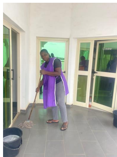
Réinsertion socio professionnelle de Dame H1