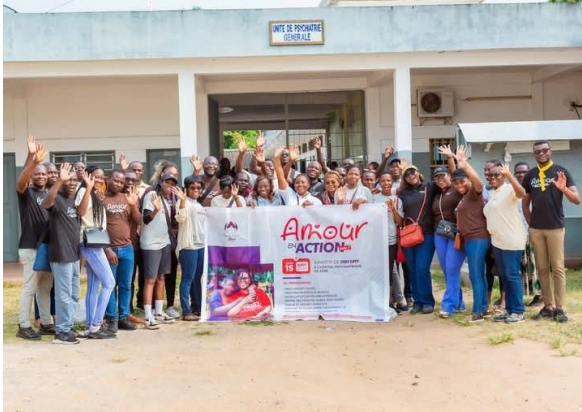
Photo de famille de toute l'équipe mobilisée sur AEA Acte 7