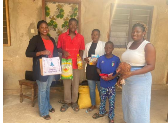
Remise de kits de vivres aux familles des bénéficiaires par l'équipe HFA