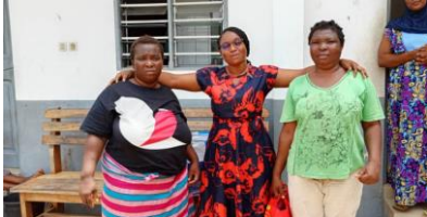
Visite de nos bénéficiaires B2 et B1 à l'hôpital psychiatrique de Zébé