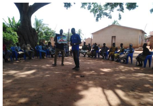
Activités avec le groupe de soutien Novilolo de Kouvé