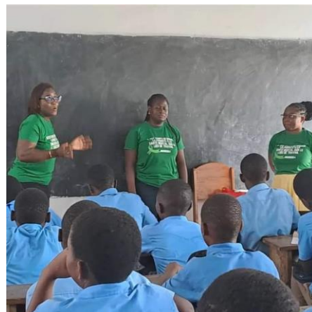
Sensibilisation à l'école secondaire EVENAK