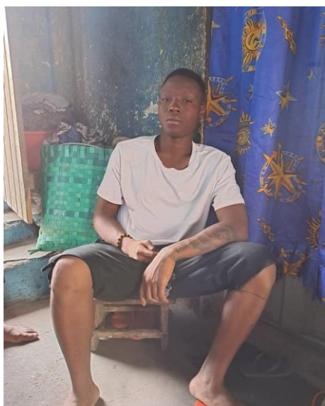
Visite à domicile du Sieur H1 pour prise de contact du cas